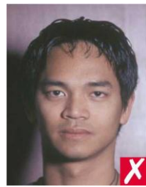
тень на фоне