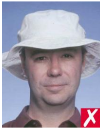
шляпа на голове