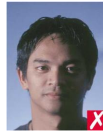
тень на лице