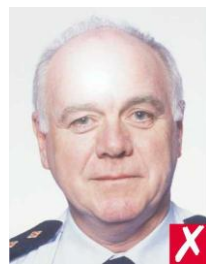
на коже рефлекс от вспышки