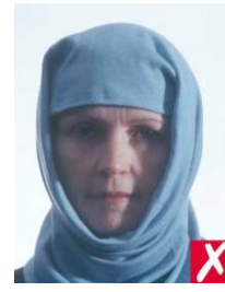
тени от платка на лице