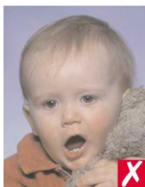
игрушка слишком близко к лицу