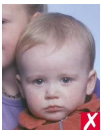
посторонний человек в кадре