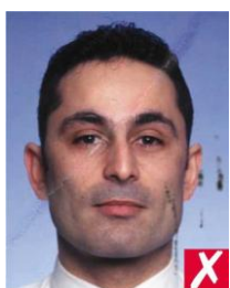
испачкано чернилами, помято