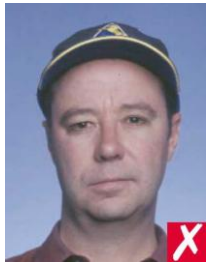
кепка на голове